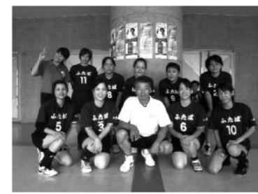
三位 ふたばクラブ