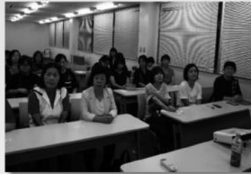
真剣に聞き入る会員の皆さん