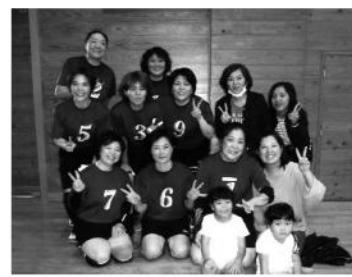
準優勝 白保クラブ