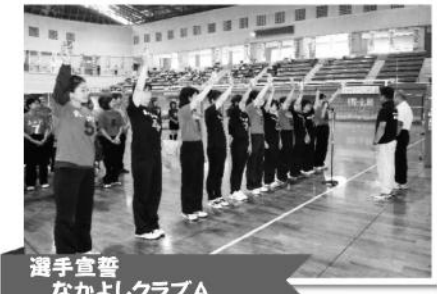
選手宣誓 なかよしクラブA