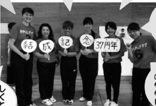
素晴らしい選手宣誓でした! なかよしクラブA