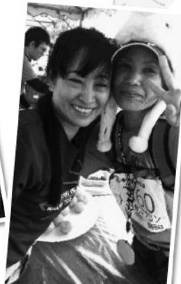
ミカちゃん、お疲れ～