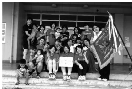
優勝 なかよしクラブA