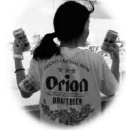
★後ろのTシャツデザイン★