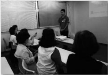
パワーポイントを使っての講習会(1時間)