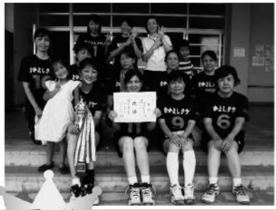
優勝 なかよしクラブ