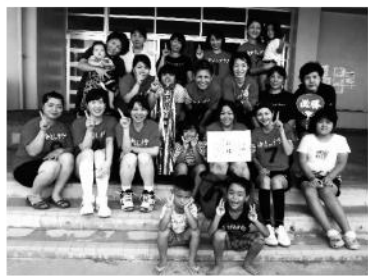
優勝 なかよしクラブ