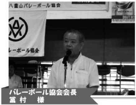
八重山バレーボール協会