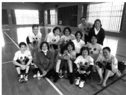
準優勝 白保クラブ