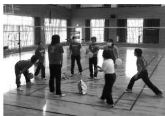
選手宣誓のウォーミングアップ?