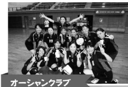
オーシャンクラブ