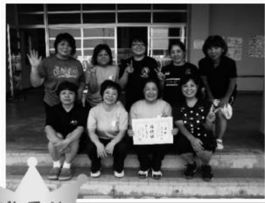
準優勝 白保クラブ