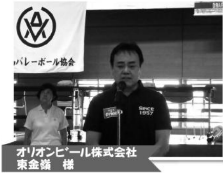
バレーボール協会

第34回 オリオンビール ママさんバレーボール大会 主催:オリオンビール株式会社・共催:八重山バレーボール協会 FOR YOUR HAPPY TIME Orion オリオンビール