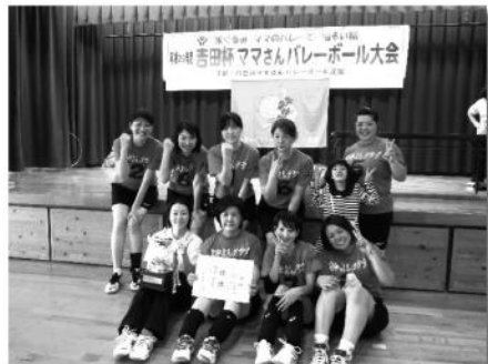
優勝 なかよしクラブ