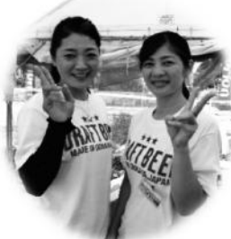
★本部席接客対応係★