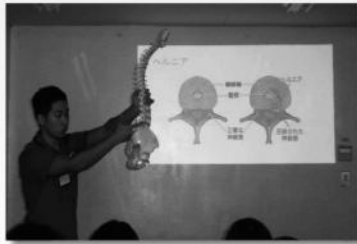
模型を使っでの説明