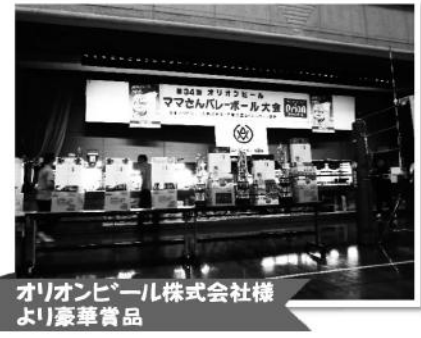
オリオンビール株式会社様 より豪華賞品