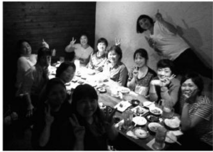
懇親会 みいふあいやー

午後六時から午後八時まで、二十六名の会員が備品袋詰め作業に協力してくださいました。ありがとうございます