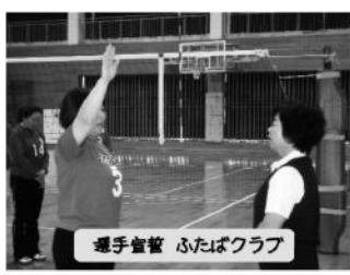
選手宣誓 ふたばクラブ